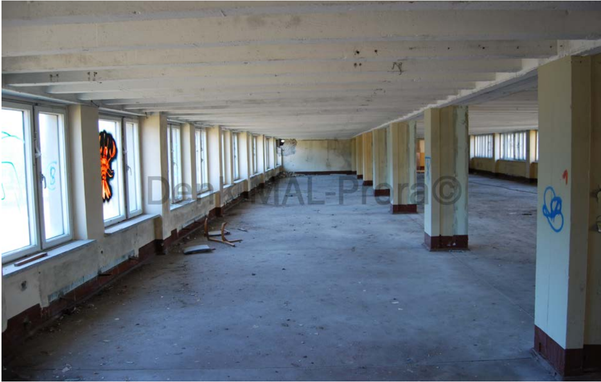
Blick nach links im 2. OG (3. LH) , inzwischen auf Höhe des heutigen Hauses Verando zugemauert, einst durchgängig, vgl. PDF Haus Natura im September 2013 .