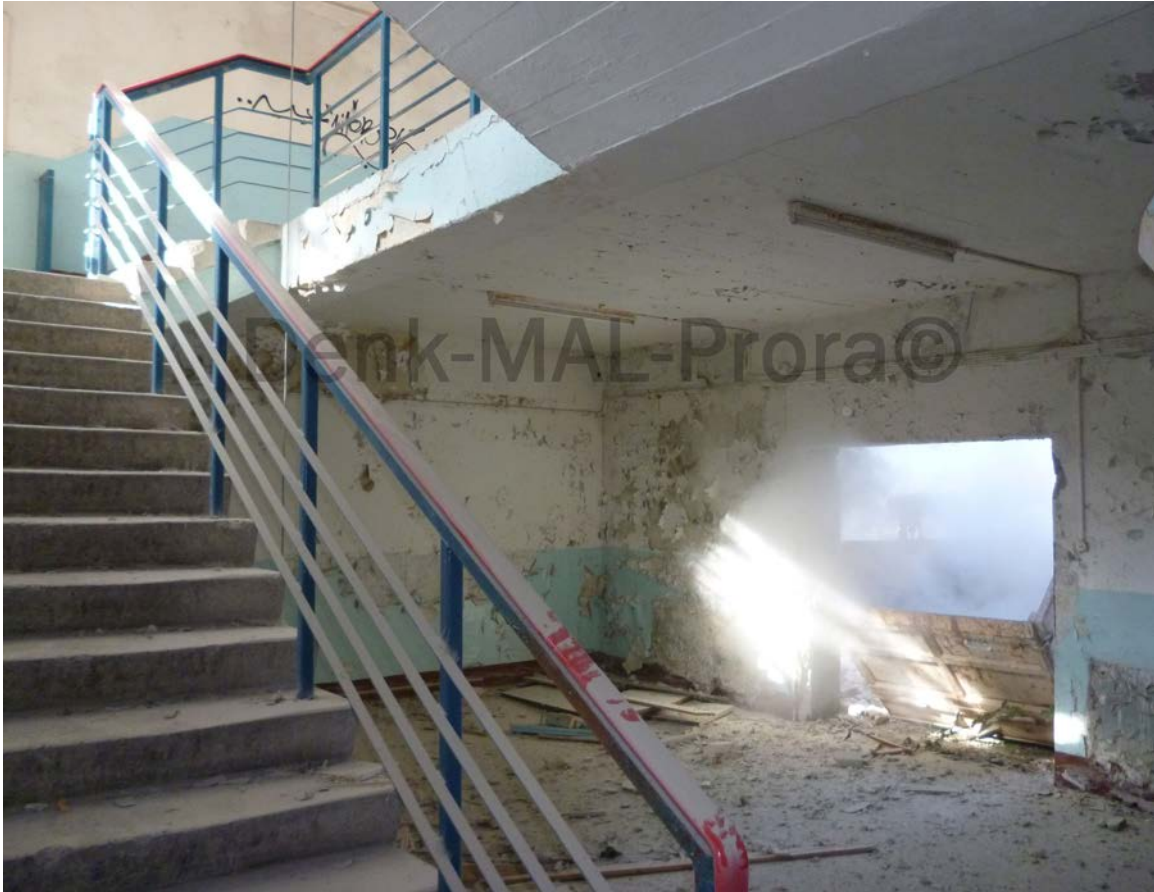
Das Kontrollfensterchen im September 2013 :