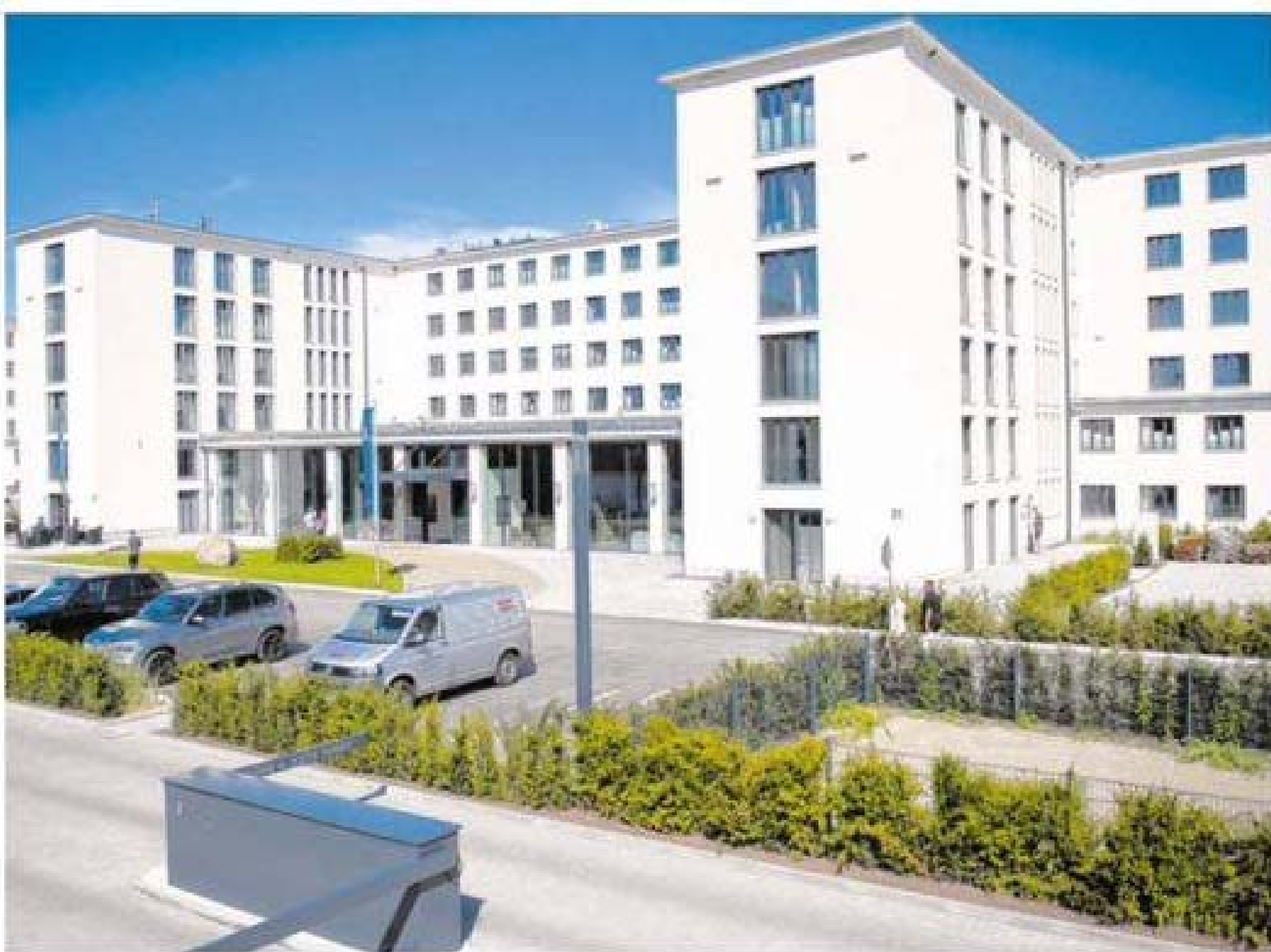
In Prora soll neben neuen Gästebetten auch touristische Infrastruktur entstehen.