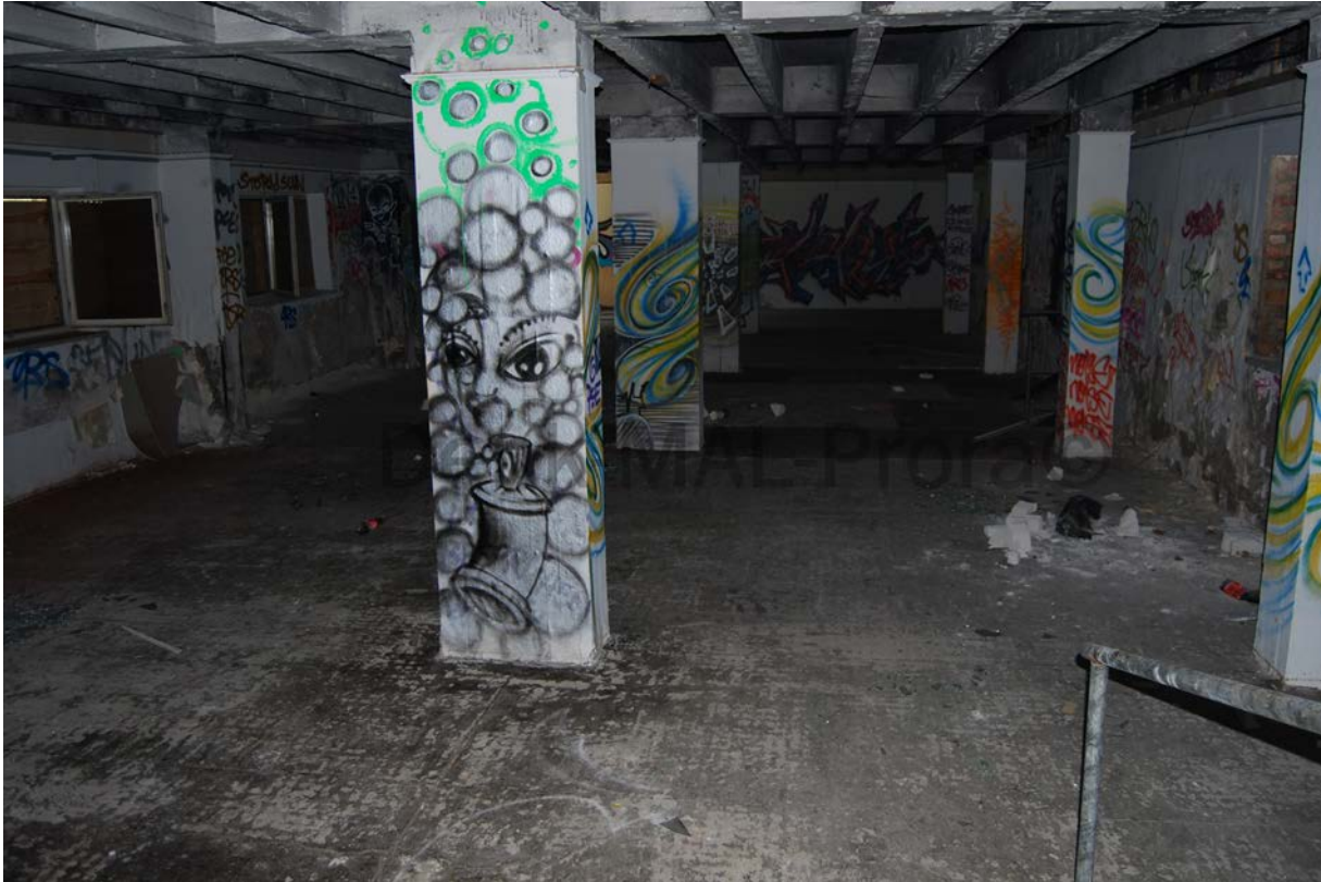
Lichthof 6 von außen (Parterre der große Speisesaal), die Tür (s.u.) ist verdeckt: